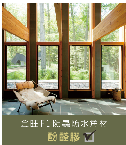
金旺F1防蟲防水角材 酚醛膠